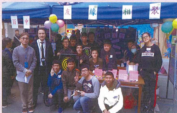
校長、老師和校友在校友會攤位前合照