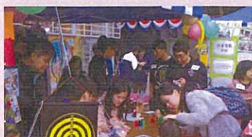
校友跟小朋友玩遊戲